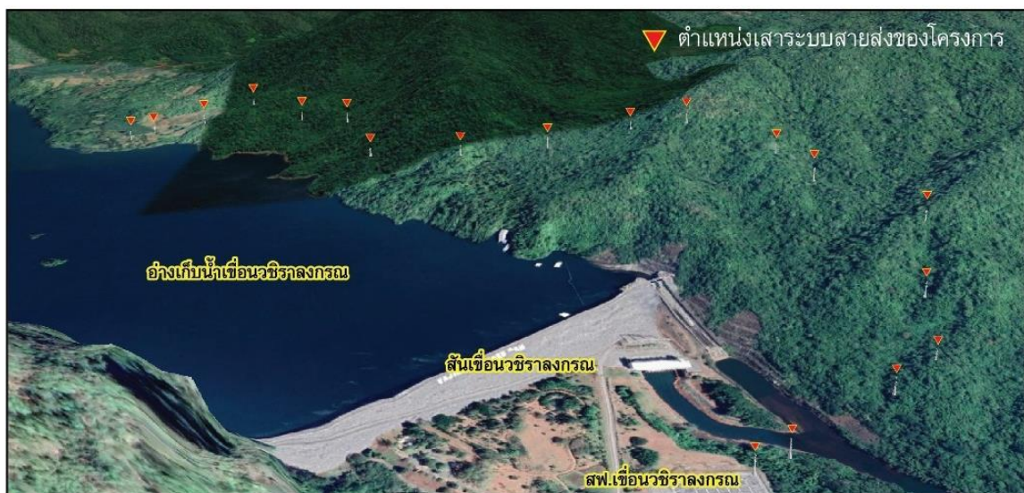
ภาพจำลองหลังมีโครงการ