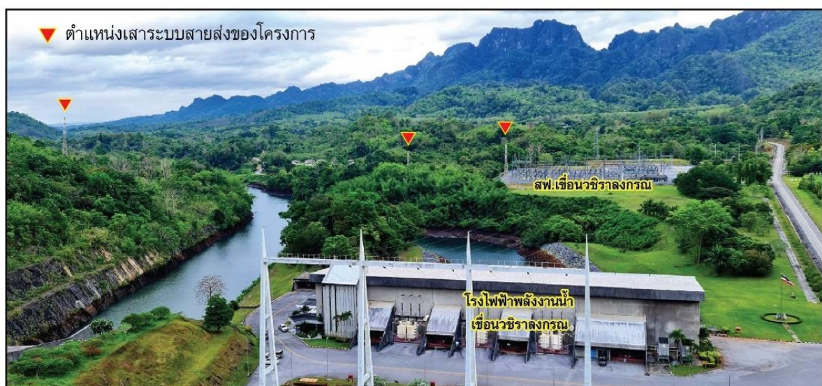
ภาพจำลองหลังมีโครงการ