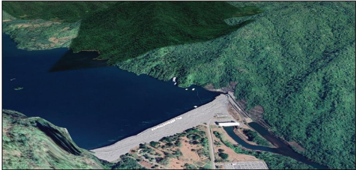
ก่อนมีโครงการ