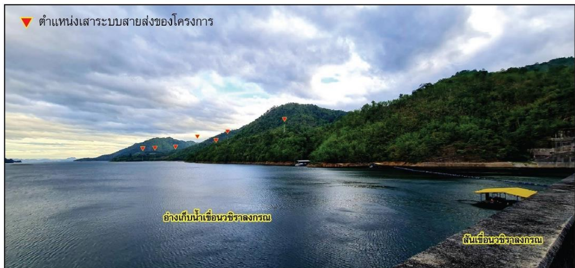
ภาพจำลองหลังมีโครงการ