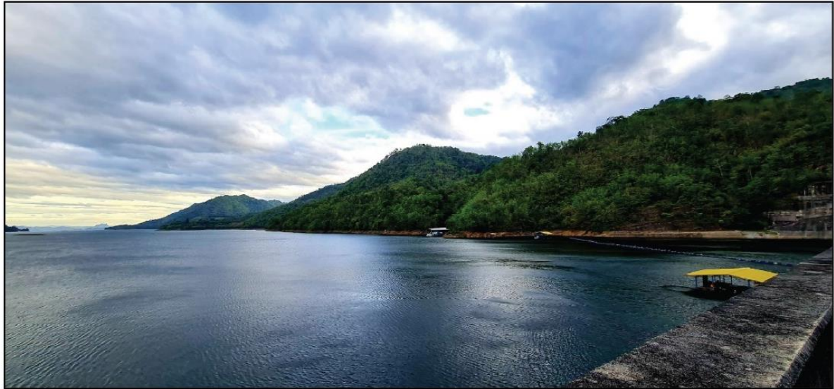
ก่อนมีโครงการ